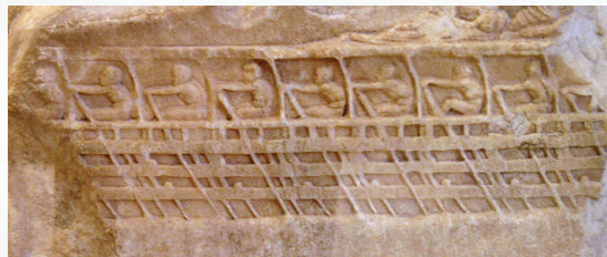
Ανάγλυφο του Charles Lenormant, Μουσείο Ακρόπολης.