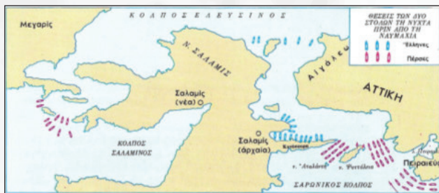
Πρώτη φάση: θέσεις των δυο στόλων τη νύχτα προ της ναυμαχίας.