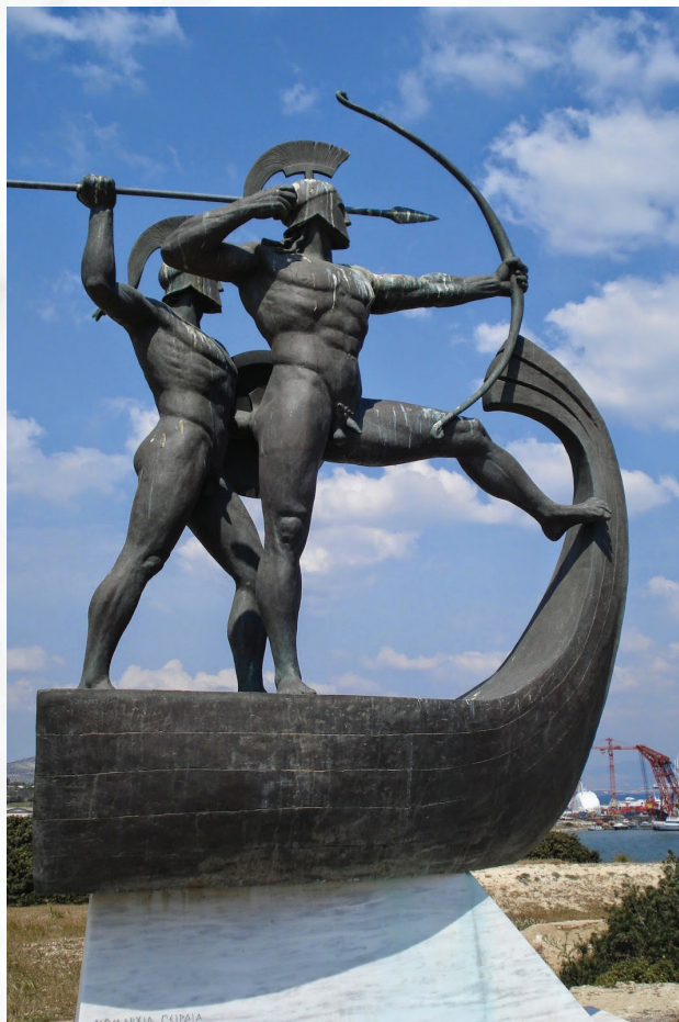
Μνημείο Σαλαμινομάχων, Κυνοσούρα, Σαλαμίνα, Αχιλλέας Βασιλείου, 2006, ορείχαλκος.