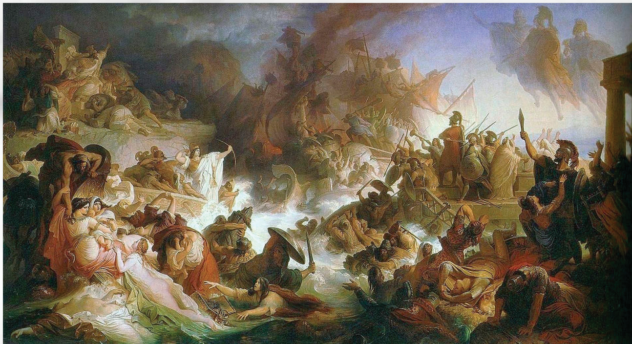
Wilhelm von Kaulbach - Die Seeschlacht bei Salamis - 1868.

πολλούς Αθηναίους οπλίτες, που είχαν παραταχθεί στην ακτή της Σαλαμίνας, τους οδήγησε σε απόβαση στην Ψυτάλλεια και αυτοί κατέσφαξαν τους Πέρσες που βρίσκονταν στη νησίδα αυτή.