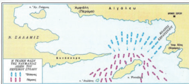
Τέταρτη φάση: τελική με την καταδίωξη του περσικού στόλου.