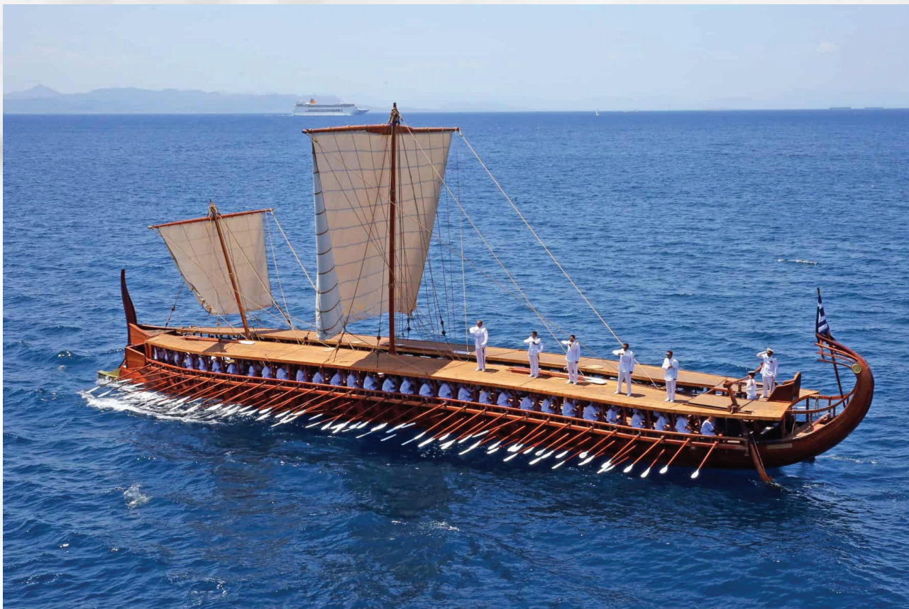
Η τριήρης "Ολυμπιάς", αντίγραφο της αθηναϊκής τριήρους.

οι Έλληνες δεν μένουν, μα στους πάγκους των πλοίων θα στρωθούν κι ο καθείς ως δύναται κρυφά για να σωθεί θε να το σκάσει.