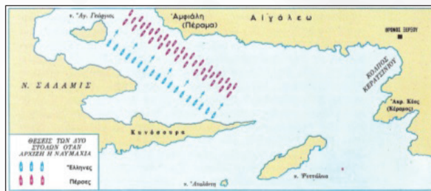
Δεύτερη φάση: θέσεις των δυο στόλων όταν αρχίζει η ναυμαχία.