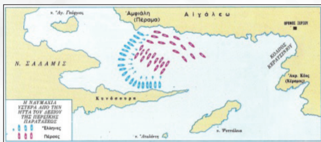
Τρίτη φάση: η ναυμαχία ύστερα από την ήττα του δεξιού της περσικής παρατάξης.