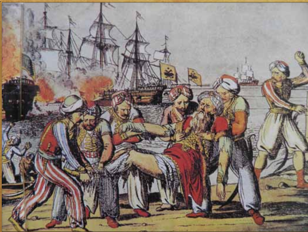
Η καταστροφή του τουρκικού στόλου στη Χίο και ο θάνατος του Καρά Αλή.

Στενόν, στενόν το πέλαγος ο τρόμος κάμνει, πέφτει ένα καράβι επάνω εις τ' άλλο και συντρίβονται· πνίγονται οι ναύται.