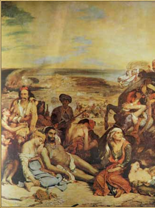
Η σφαγή της Χίου, Ευγένιος Ντελακρουά (Μουσείο Λούβρου, Παρίσι).

ώτες με εντολή να μην αφήσουν τίποτε όρθιο. Οι σφαγές της Χίου ξεσήκωσαν ως γνωστό την αγανάκτηση της δυτικής Ευρώπης. Ο Delacroix ζωγραφίζει τον γνωστό πίνακα και ο Victor Hugo γράφει ένα ποίημα που αρχίζει έτσι: