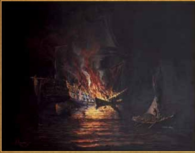
Η πυρπόληση της τουρκικής ναυαρχίδος στη Χίο. Ελαιογραφία Αριστοβούλη Λοπρέστη, επεξεργασία Κωνσταντίνου Βολανάκη (Ναυτικό Μουσείο της Ελλάδος).

....Να η κραυγαί και ο φόβος να η ταραχή και η σύγχυσις· από παντού σηκώνονται και απλώνουν πολυάριθμα πανιά να φύγουν.