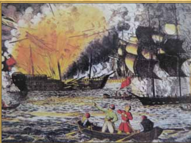
Η ναυμαχία της Τενέδου σε γερμανική λιθογραφία.

Τον Αργολικό κόλπο όπως φυλάγει ο μικρός ελληνικός στόλος. Παρά την διαφορά δυνάμεων ο Μεχμέτ Πασάς, μη θέλοντας να υποστεί την τύχη του προκατόχου του, δεν τολμά την αναμέτρηση. Αφήνει το Ναύπλιο στην τύχη του και κατευθύνει το στόλο πρώτα στον κόλπο της Σούδας, στην Κρήτη, κι ύστερα, για να νοιώθει κοντά του την ασφάλεια των Δαρδανελίων, κατευθύνεται βόρεια και αγκυροβολεί μεταξύ Τενέδου και Ασιατικής ακτής.