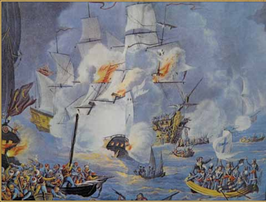
Η ναυμαχία της Τενέδου το 1822 όπου Κανάρης και Βρατσάνος πυρπόλησαν τον τουρκικό στόλο.

στόλο με τα 84 πολεμικά, ανάμεσα στα οποία πολλά δίκροτα και φρεγάτες, στην περιοχή του Αργολικού κόλπου. Το Ναύπλιο πολιορκείται στενά απ' τον Κολοκοτρώνη και, αν δεν ανεφοδιασθεί απ' τον στόλο, θα παραδοθεί.