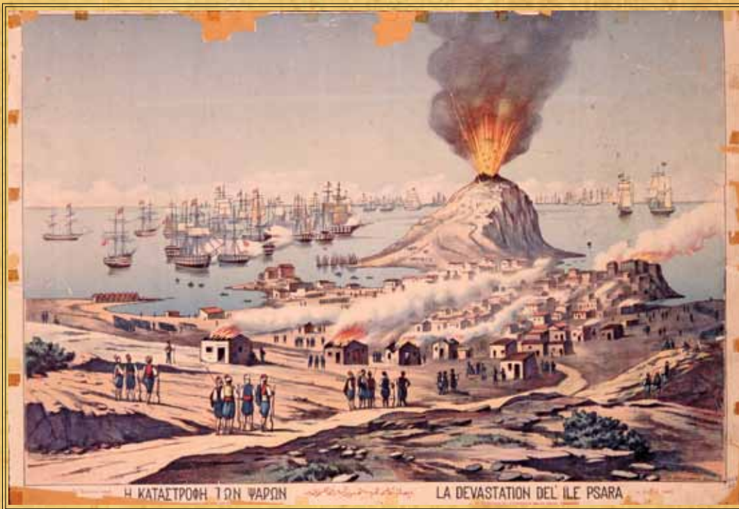
Η καταστροφή των Ψαρών.

ματα. Ναύαρχος ορίζεται ο Χοσρέφ Μεχμέτ Πασάς. Παράλληλα εξασφαλίζεται η εναντίον των Ελλήνων σύμπραξη και του αιγυπτιακού στόλου. Ο στόλος του Χοσρέφ το 1823 προβαίνει μόνο σε ανεφοδιασμό της Μεθώνης και της Κορώνης και σε κάποιες αγριότητες στην περιοχή της Καρύστου και του Θερμαϊκού. Στον Θερμαϊκό εμφανίζονται κάποια πυρπολικά υδράϊκα και ψαριανά και ο Χοσρέφ, έντρομος, φεύγει για τον Ελλάσποντο.