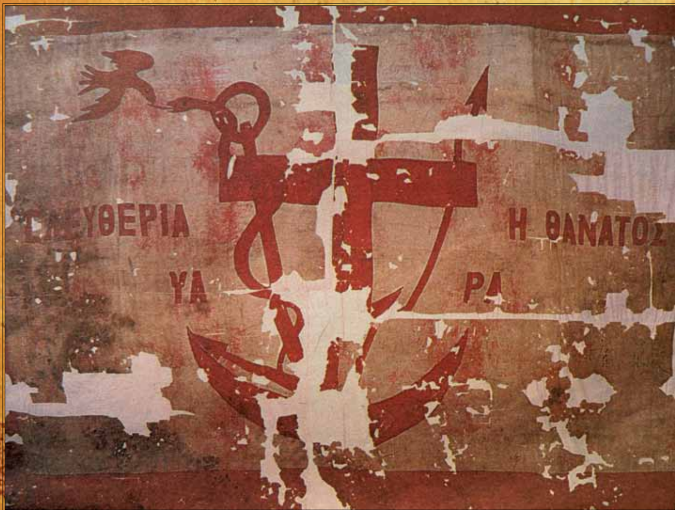
..... Πολεμική σημαία των Ψαρών, διαστάσεων 4,50 x 6,40 μέτρων, Εθνικό Ιστορικό Μουσείο.

Έπιλογή εικονογραφικού υλικού & επιμέλεια: Πανελλήνιος Όμιλος Ιστιοπλοΐας Ανοικτής Θαλάσσης