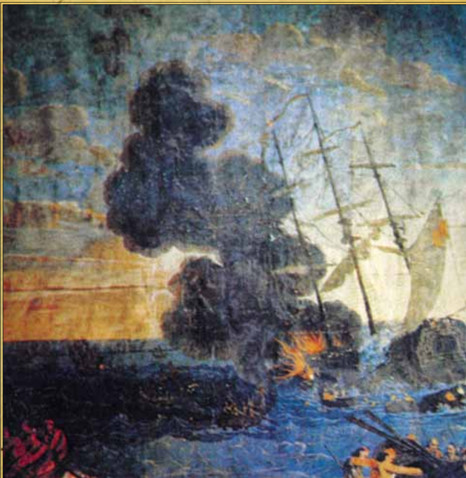
..... Τα ναυτικά κατορθώματα των Ελλήνων σε γαλλικό έντυπο της εποχής.

Το 1825 ο Κανάρης πρωταγωνιστεί σ' ένα παράτολμο εγχείρημα: επιχειρεί να κάψει τον στόλο του Ιμπραήμ μέσα στη βάση του, στο λιμάνι της Αλεξάνδρειας. Τον Ιούλιο δύο πολεμικά, με τον Εμμ. Τομπάζη και τον Αντ. Κριεζή, φεύγουν απ' την Ύδρα, συνοδευόμενα