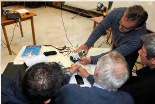
Πάνω: Πρακτική εκπαίδευσης στις ναυτικές επικοινωνίες. Κάτω: Επίσκεψη μαθητών της Σχολής Ναυτικών Επικοινωνιών στο “OLYMPIA RADIO”.

Επί πλέον, από το 2015 λειτουργεί η Σχολή Ναυτικών Επικοινωνιών εφοδιασμένη με ένα πρότυπο εκπαιδευτικό εργαστήριο για να καλύψει το κενό της πολιτείας που προκύπτει από τις διεθνείς υποχρεώσεις της χώρας στη χρήση επικοινωνιών για τους μη επαγγελματίες ναυτικούς. (NON SOLAS)