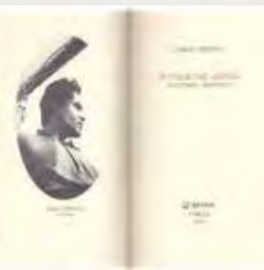
Αριστερά: Ο Σάββας Γεωργίου με τη σύζυγό του Σούζαν. Πάνω: Το βιβλίο με τα απομνημονεύματα του ταξιδιού του.